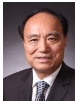
Houlin Zhao Secretario General de ITU

Los avances en la tecnología del video han cambiado nuestro mundo, revolucionando el entretenimiento, conectando a amigos y familiares alrededor del mundo, enriqueciendo nuestras experiencias de comunicación y permitiendo importantes mejoras en la atención médica y la educación.